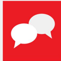
6. TALA SAMAN