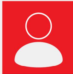
5. ÁBYRGÐ STJÓRNENDA